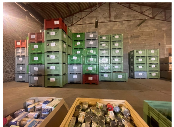
J+1: tout est rangé au Mas neuf